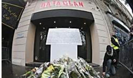
LE DAUPHINÉ LIBÉRÉ Une élue condamnée pour avoir harcelé le père d'une victime du Bataclan