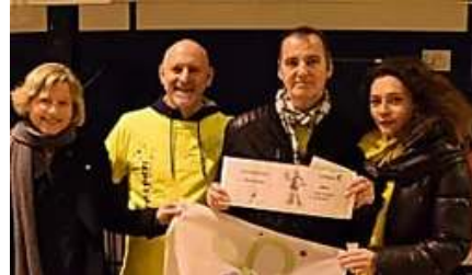
LE DAUPHINÉ LIBÉRÉ Un Téléthon 2017 à vite oublier