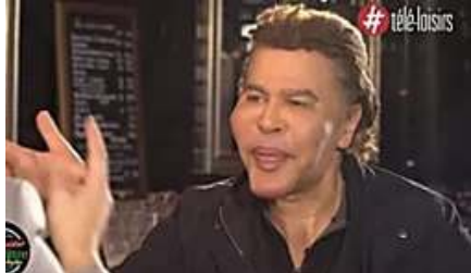
LE DAUPHINÉ LIBÉRÉ Grichka Bogdanoff révèle ce qui a modifié son visage